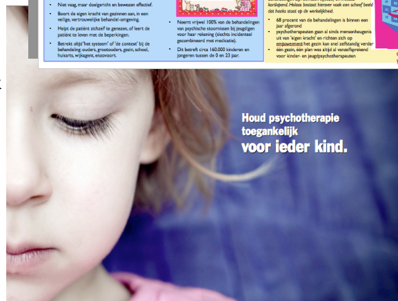
Vereniging voor Kinder- en Jeugdpsychotherapie - VKJP