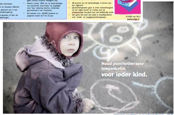
Vereniging voor Kinder- en Jeugdpsychologie - VKGJ